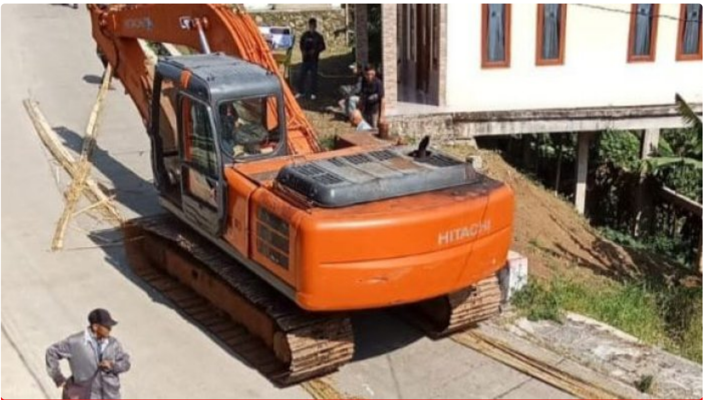
Photo Alat Berat PT.BSS

Bogor, Warta.id - Puluhan warga masyarakat Cipelang melakukan aksi demo di Kampung Pasir Pogor RT 03 / RW 07, Desa Cipelang, Kecamatan Cijeruk, Kabupaten Bogor. Pasalnya jalan tersebut yang dilintasi paksa merupakan akses Warga yang juga baru dibangun Dari Anggaran Program SAMISADE . alat berat melintas paksa dari Jl. KH. Halimi No. 04 Desa Cipelang - Cijeruk 16781.